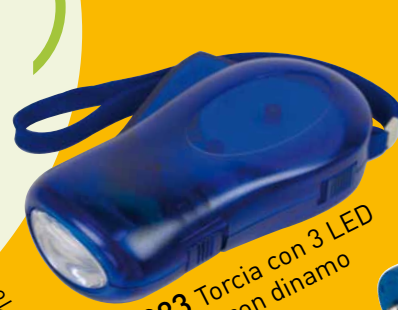
A 00323 Torcia con 3 LED ricaricabile con dinamo a pag 139

...e te lo realizzati più bello dimostriamo proponendoti tanti prodotti pensando alla salvaguardia del pianeta dell'universo: il nostro.