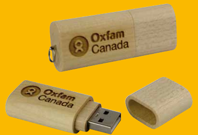
Pen drive USB in legno FSC