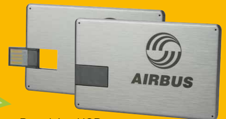
Pen drive USB in alluminio a forma di card

Completamente realizzate con materiali riciclati