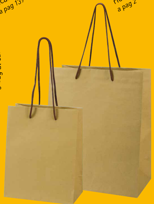
A 02617 - A 02618 Buste in carta a pag 162