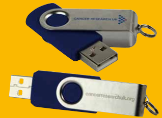
Pen drive USB con chiusura a rotazione