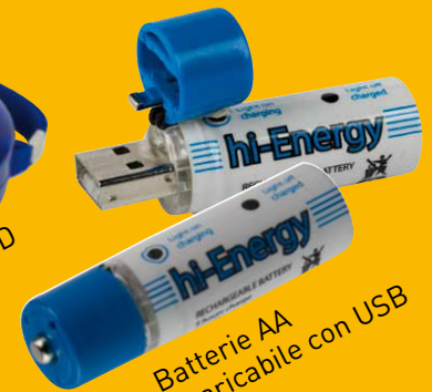
Batterie AA ricaricabile con USB a pag 2