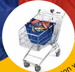
A 19311 Shopping bag, ganci con velcro per attaccare la shopping bag al carrello della spesa pag 160